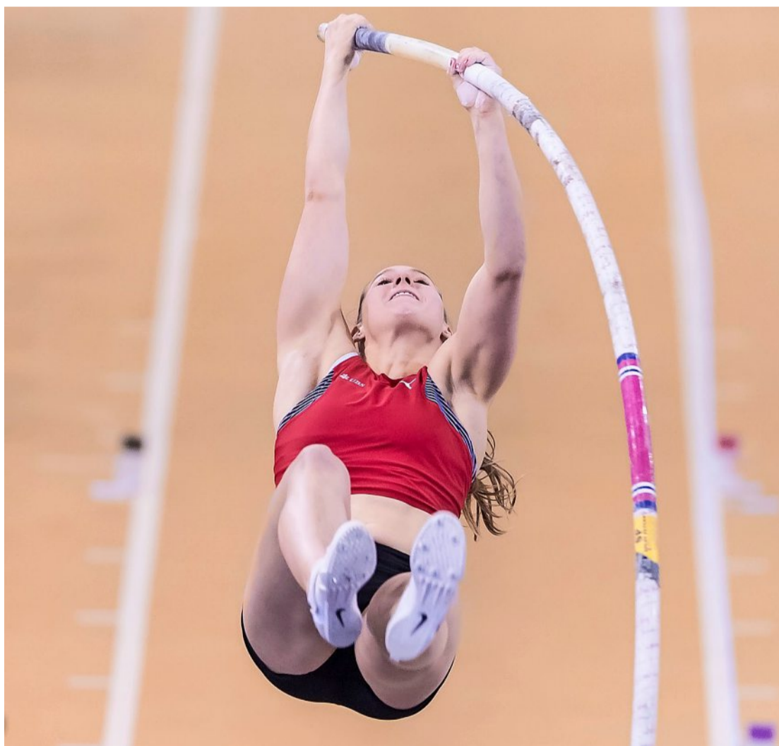
Elegant über 4,65 m: Angelica Moser war in Glasgow deutlich besser als erwartet.

Ich sprang während den sechs Hallensaison-Wochen sehr kon-stant – ausser in jenem Wett-kampf in Polen, bei dem niemand auf Touren kam. Also wusste ich: